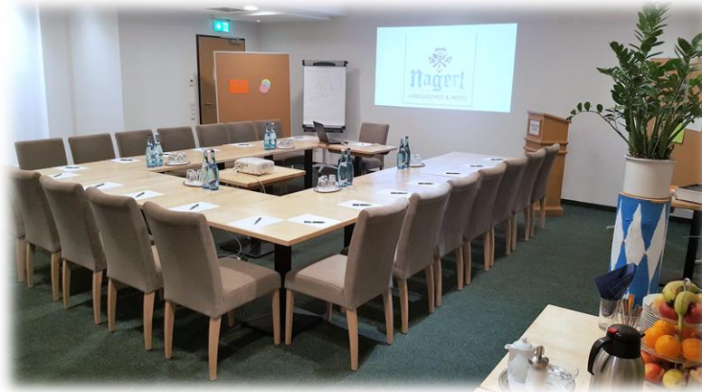
Bildbeispiel Isar 1 + 2